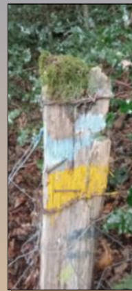
Le marquage, en bleu ciel.