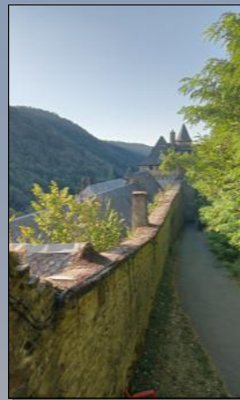
Vers Espalion, 7 km, au départ de la Tour.