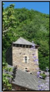
Salle d'accueil des pèlerins...